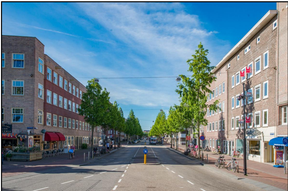
Newtonstraat 25 H - AMSTERDAM