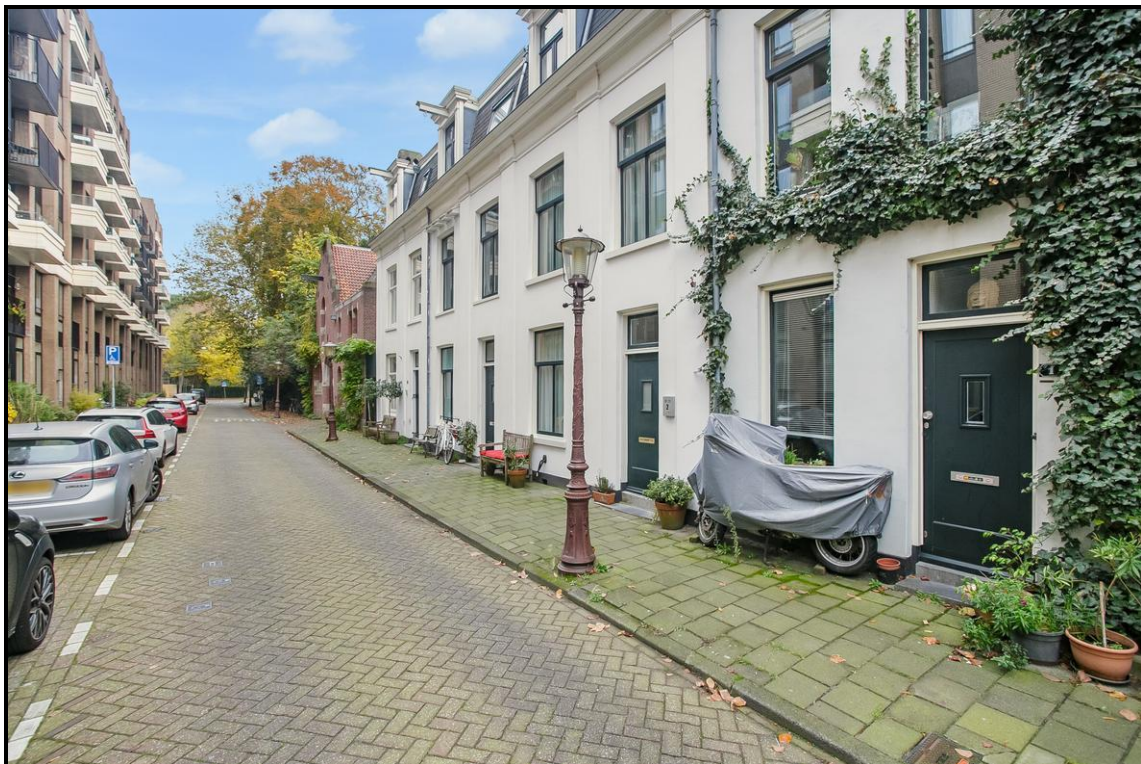
Plantage Lepellaan 2 - AMSTERDAM